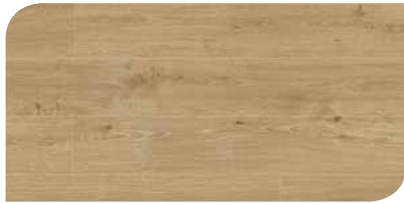
LOMP40063 ROVERE IDEALE NATURALE