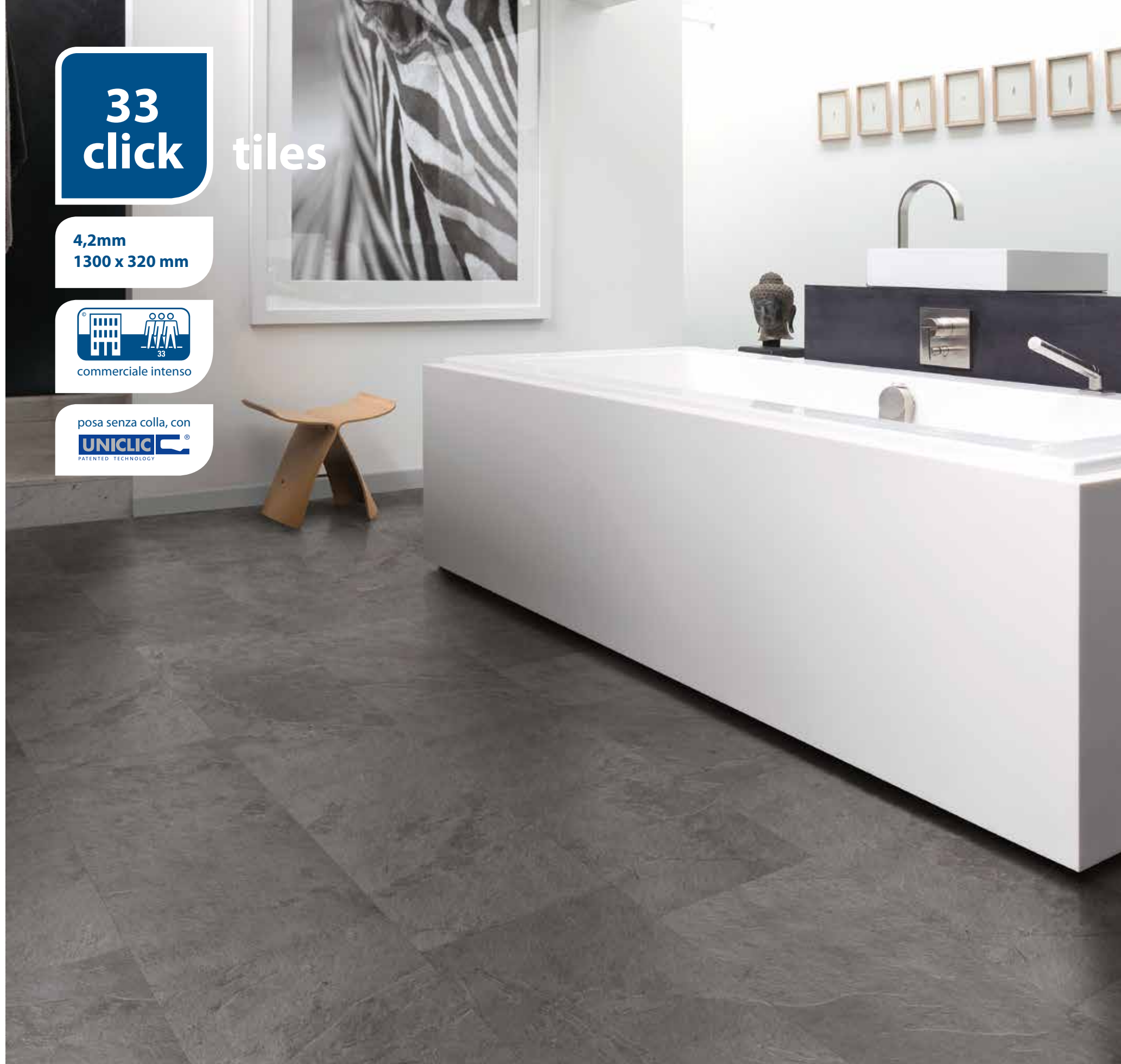
LOTP40034 PIETRA SPACCATA

Se la pietra, oltre che resistente, fosse calda e confortevole sarebbe forse il materiale perfetto. Dato che non è così, perché non scegliere un pavimento forte e affascinante, dall'effetto minerale, ma con tutto il confort della superficie vinilica e la praticità di posa del sistema a incastro Uniclic? Con LOC 33 click formato piastra il risultato è eccezionale, in soli 4,2 mm di spessore.