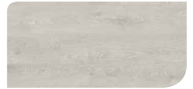
LOCL40146 ROVERE REALE GRIGIO