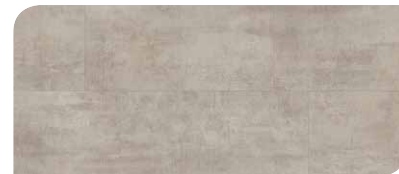
LOTP40047 ARENARIA GRIGIO CHIARO