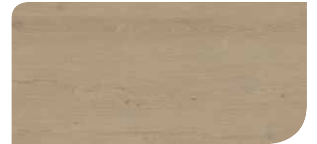
LOCL40153 ROVERE ELEGANTE TORTORA