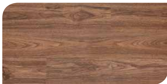
LOMP40125 NOCE AMERICANO CLASSICO