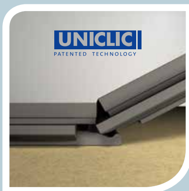
Incastro super performante