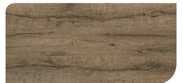
LOCL40155 ROVERE KINGSTON MARRONE