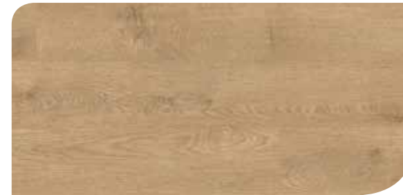
LOCL40145 ROVERE REALE NATURALE