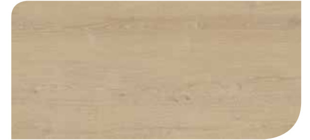
LOCL40147 ROVERE ELEGANTE DORATO