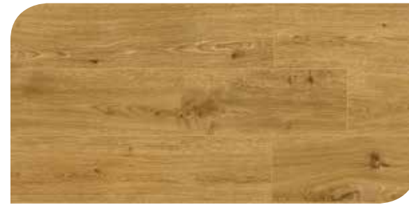
LOMP40064 ROVERE IDEALE DORATO