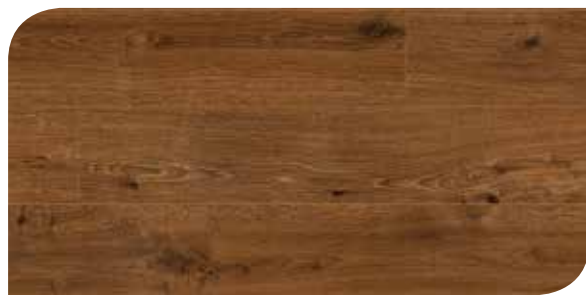
LOMP40066 ROVERE IDEALE MARRONE