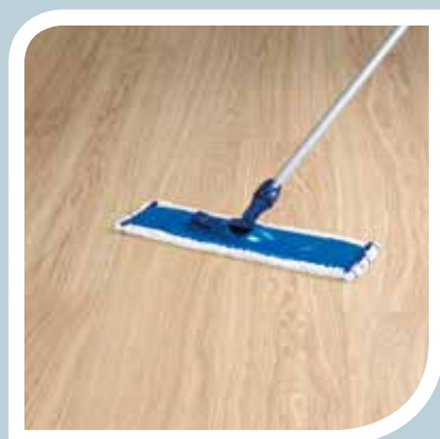
Facile da pulire