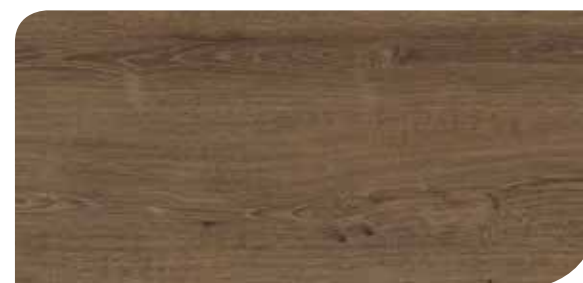
LOCL40149 ROVERE ELEGANTE MARRONE