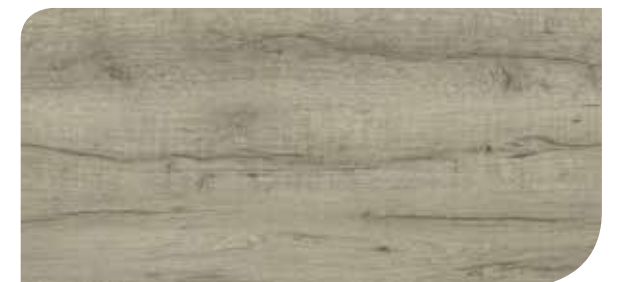
LOCL40150 ROVERE KINGSTON TORTORA