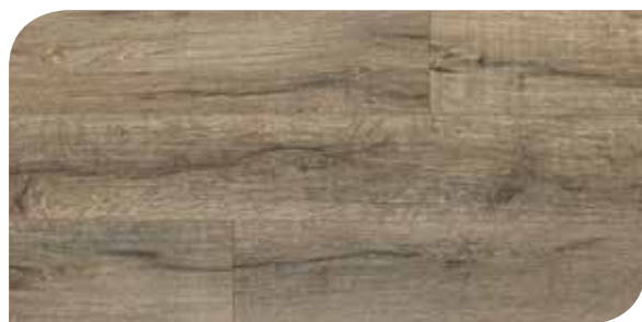
LOMP40109 ROVERE CAVA GRIGIO