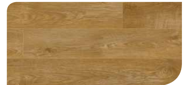
LOCL40065 ROVERE REALE RUSTICO