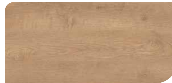
LOCL40151 ROVERE REALE INTENSO