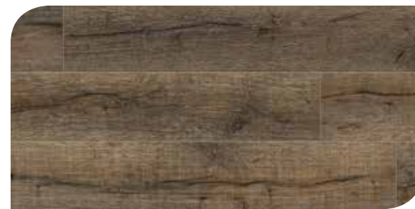
LOMP40061 ROVERE ANTICO GRIGIO