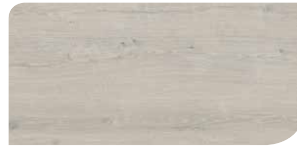
LOCL40152 ROVERE ELEGANTE GRIGIO

4,2mm • Dimensioni:1251 x 187 mm • Bisellato sui 4 lati • Garanzia 15 anni