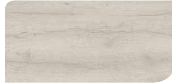
LOCL40154 ROVERE KINGSTON GRIGIO