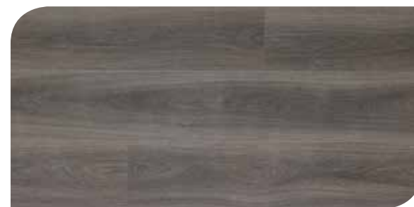
LOMP40124 ROVERE CLASSICO CARBONE