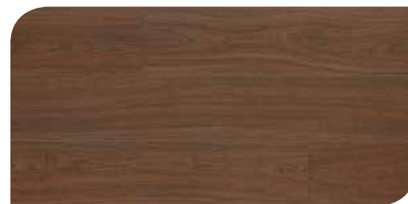
LOMP40108 PALISSANDRO CLASSICO