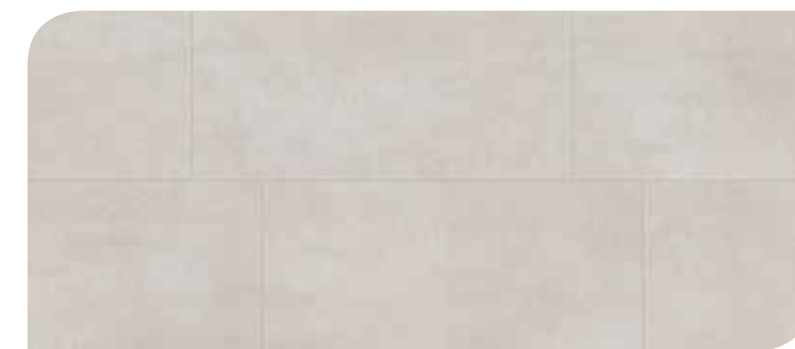
LOTP40049 CEMENTO GRIGIO CHIARO

4,2mm • Dimensioni: 1300 x 320 mm • Bisellato sui 4 lati e al centro • Garanzia 20 anni