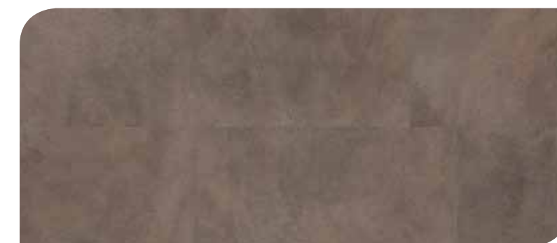
LOTP40045 ACCIAIO CORTEN