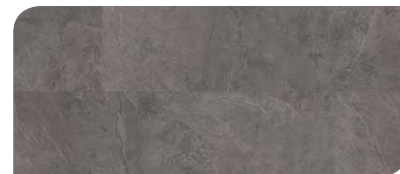
LOTP40034 PIETRA SPACCATA

Per un effetto più naturale, le piastre sono divise al centro da una bisellatura tridimensionale identica a quella sui lati.