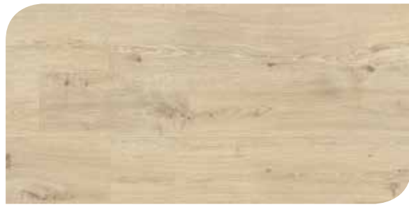
LOMP40062 ROVERE IDEALE BEIGE