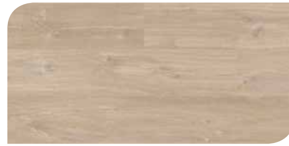
LOMP40057 ROVERE SERENO BEIGE