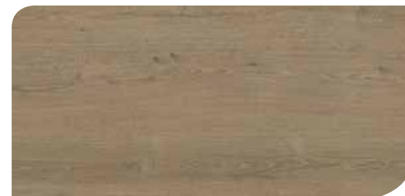
LOCL40148 ROVERE ELEGANTE BEIGE